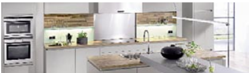
olina Exklusivmodell „Estetica“

Neben der olina Alleinstellung „NOVA–Glasdesignelemente“ gibt es ab sofort das grifflose Exklusivmodell „Estetica“, welches in Matt und Hochglanz erhältlich ist. Ein weiteres Highlight bei olina!