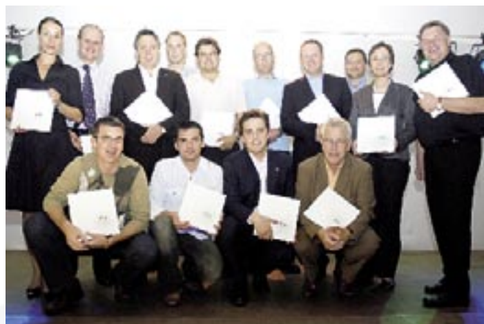
Auch unseren Hauptlieferanten wurde das oline Küchenbuch überreicht

Am Sonntag Vormittag wurden intern Neuerungen für die Franchisepartner besprochen und das gelungene Wochenende mit dem Thema „Mit Motivation in die nächste oline Runde“ abgeschlossen.