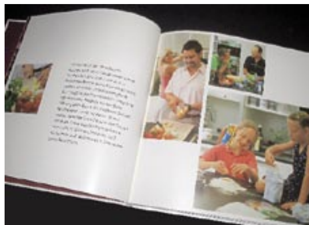
Das neue olina Küchenbuch