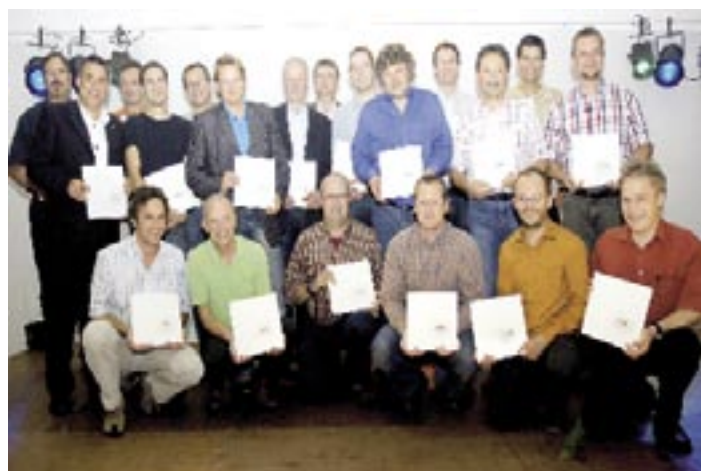
Unsere Franchisepartner mit ihren druckfrischen Küchenbuchexemplaren